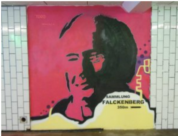
Zusammen mit dem Harburger Künstler Toro für die Sammlung Falckenberg entworfen.

der finanziellen Unterstützung gerade kleinerer, weniger etablierter Kulturräume, damit zum Beispiel junge KünstlerInnen die Möglichkeit haben, ihre Werke auszustellen. In diesem Zusammenhang ist mir auch das Künstlerhonorar ein Anliegen. Künstler bezahlen in der Regel dafür, ihre Kunst der Öffentlichkeit zeigen zu dürfen. Da wäre ein Umdenken dringend erforderlich, denn meines Erachtens leisten KünstlerInnen mit ihren Arbeiten einen wichtigen kulturellen Beitrag für die Gesellschaft! Das wäre genauso, wie wenn ein Musiker dafür zahlen würde, um ein Konzert zu spielen. Ich finde das irgendwie paradox. Selbstverständlich wünsche ich mir auch wesentlich mehr Flächen für Kunst im öffentlichen Raum.