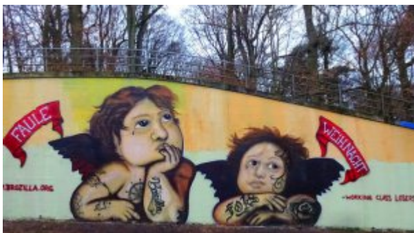
„Faule Engel“ zieren Ende 2016 die Sprayer-Wand in der Haake.

B: Im zarten Alter von 12 Jahren kam ich über die HipHop-Bewegung in Kontakt mit Graffiti. Mir gefielen die Bilder an der Bahnlinie und auf Zügen und mich begeisterte es, die Stadt farblich zu gestalten und überall seinen Namen zu hinterlassen. Für mich war und ist Graffiti eine Bereicherung für jeden urbanen Raum, ich konnte nie nachvollziehen, warum das so eine wahrgenommene Bedrohung darstellen soll.