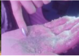
Die Arbeiten des Nachwuchses