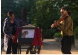
Leichte Sprache und Ladies Crime