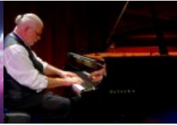
Der Geschichtler des Klaviers