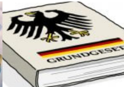
75 Jahre Grundgesetz. Nie wieder ist jetzt