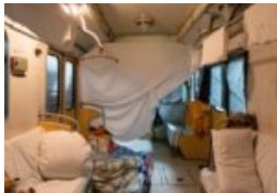
the new abnormal