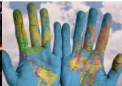
Künste öffnen Welten!