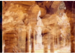
Das Manifest des Lichtes