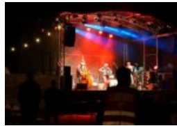
Kultursommer Hamburg mit über 1.800 Veranstaltungen...