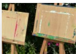
Kunststipendien an herausragende Künstler*i...