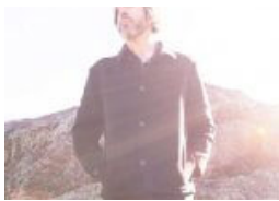
Klangwellen im Hafen