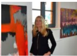
Bilder bei die Fische! En Punk mitn Tüdelband