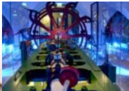
Ein Stück Lauenburg in Winsen