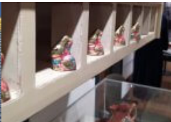
Ostern im Marstall