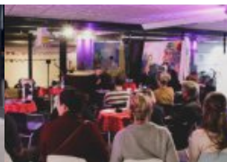
Von Hexen, Punks und Heimweh