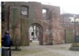
3falt: Kunst - Kultur - SuedKultur - jetzt Kreativität