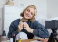
Meine Lieblings- Influencerin