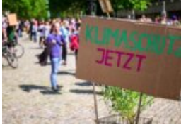
Demo oder Knast?