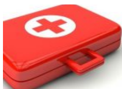
Wofür war die Soforthilfe?!