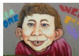
„Kultur spielte im Wahlkampf keine Rolle“