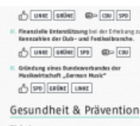
„Abgaben runter – Förderung hoch!“