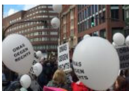
Die Omas gegen rechts