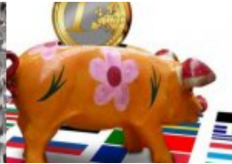
Nach dem Brexit kommt das große Sparen