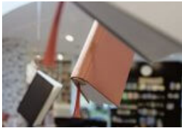
Garant für Qualität