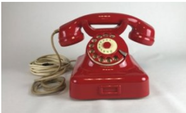
„Lieblingsstücke“ wie das Rote Telefon im ´electrum`