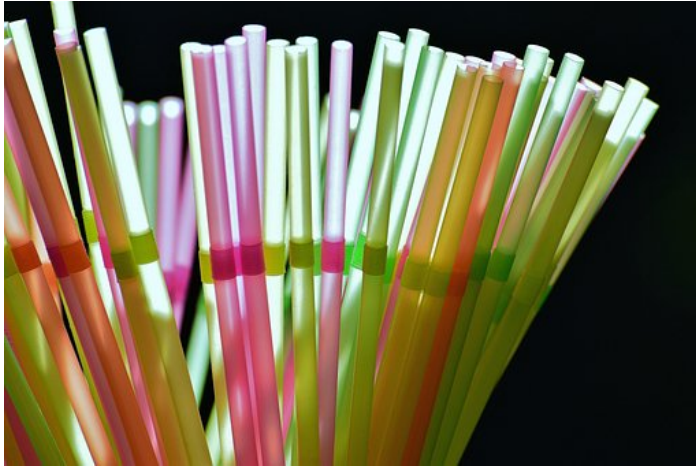
Über im Flüssig

Kurzum: Ideen werden gesammelt und umgesetzt, möglichst jeden Plastikmüll im Nachtleben zu meiden. Back to Stroh-Halm im wahrsten Sinne. Die Trinkröhren gibt es übrigens mittlerweile auch edel aus Glas – aber unpraktisch und teuer im Club-Alltag. Ein Tipp an die Clubs war so aber auch: Halme für Drinks überhaupt erst auf Nachfrage rauszugeben.