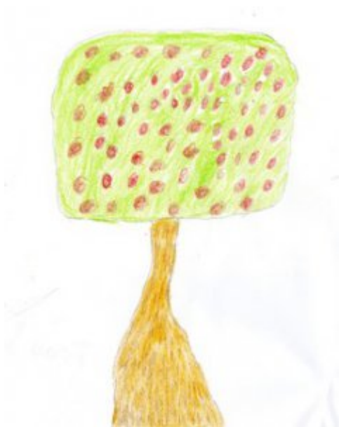
Baum einer Demenzerkrankten