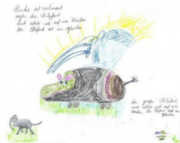
Text: Ringelnatz

Zum Thema Kunst als Sprache der Intuition hat Hinrichs gerade das gleichlautende Fachbuch veröffentlicht.