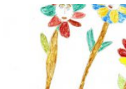
Kunst als Erfahrung der Wirklichkeit