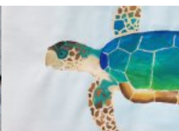
„Wir schenken dir Kraft!“