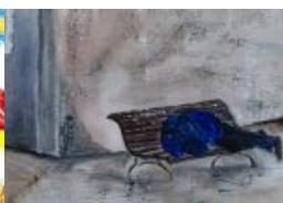
Bezahlbares Wohnen als Kunst