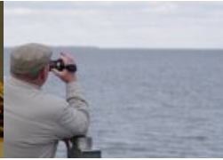
Inklusion in den Köpfen